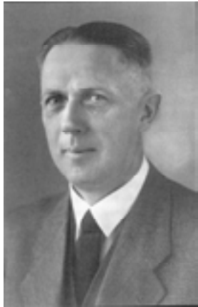
Wilhelm Kritzinger (1890-1947)