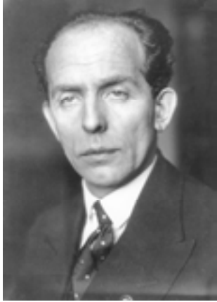
dr Roland Freisler (1893-1945)