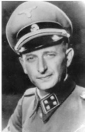
Adolf Eichmann (1906-1962)