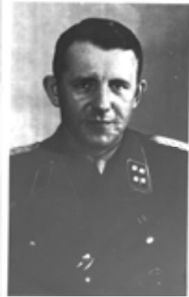
dr Rudolf Lange (1910-1945)